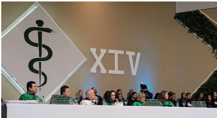
Colação da ESCS