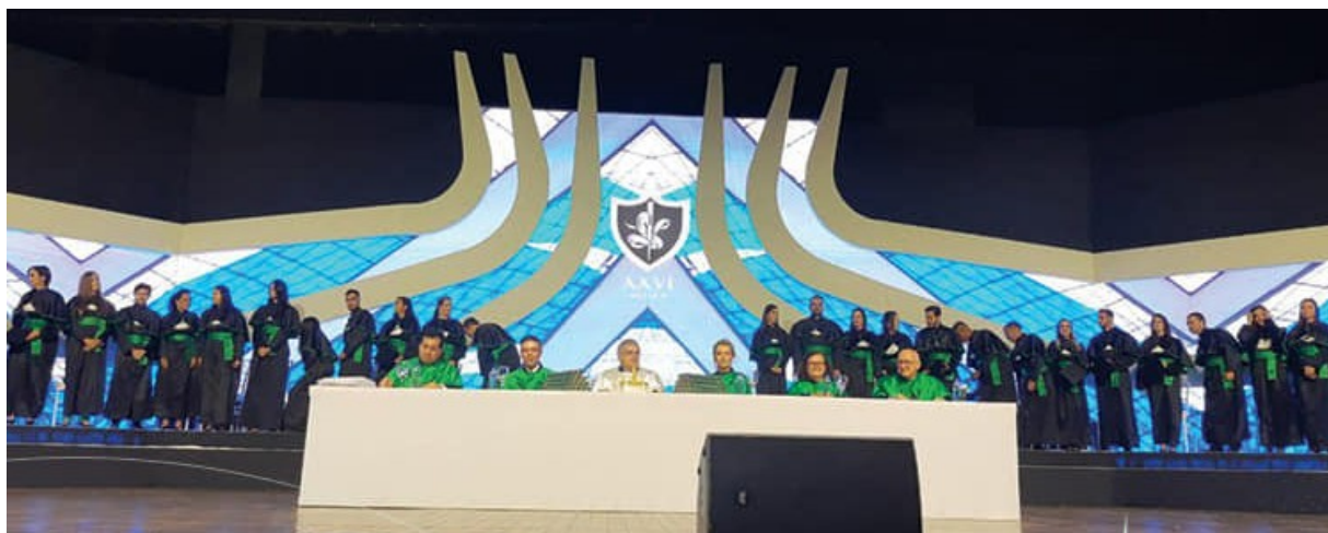
Colação da Católica

No dia 20, foi a vez dos formandos de medicina da 26ª turma da Universidade Católica de Brasília realizarem a cerimônia simbólica de colação de grau, no Centro de Convenções Ulysses Guimarães. Na ocasião, o presidente do CRM-DF parabenizou os novos médicos do Distrito Federal.